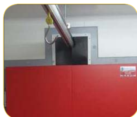
Passage de rail