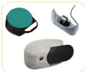
Fermeture gâche contact