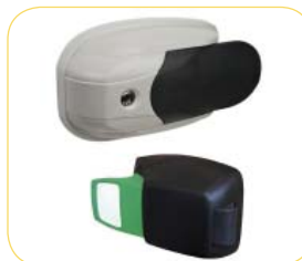
Fermeture à gâche sur chant de l'huissierie