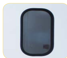
Oculus entourage EPDM