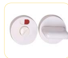
Verrou "WC" PVC